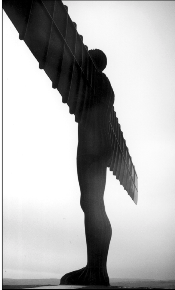
Anthony Gormleys "the Angel of the north"